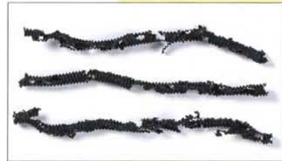
[ねずみ被害にあった忌避剤含有なしのコルゲート管]